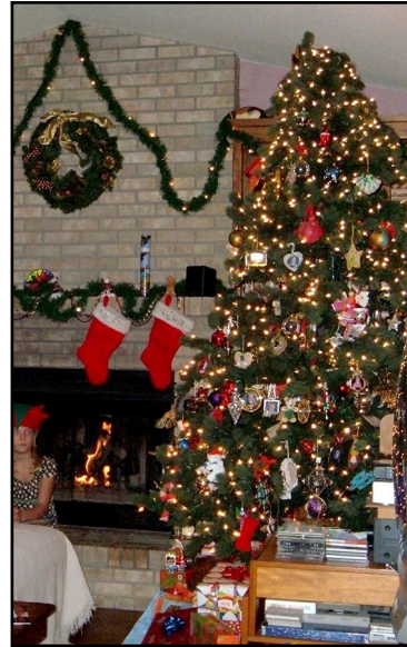
Keep candles away from the Christmas tree.